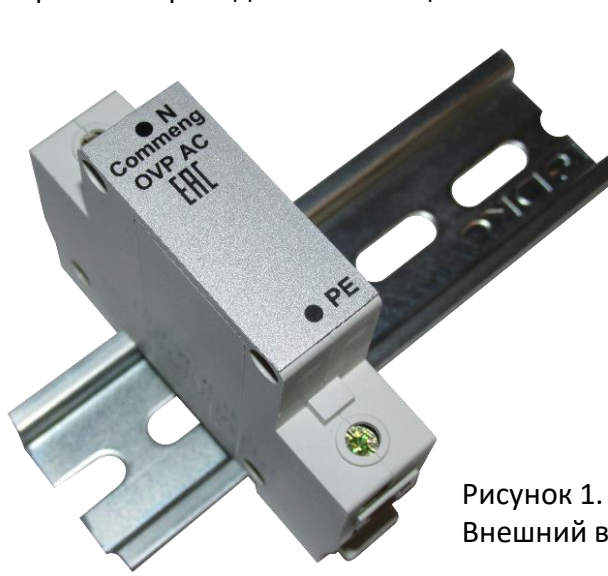
Рисунок 1. Внешний вид

Commeng OVP-2N AC 280/40 устройство защиты от импульсных помех (УЗИП), предназначенное для защиты одно- и трехфазных электроустановок и цепей питания переменного тока 220/380 (230/400)В от импульсных перенапряжений. Внешний вид устройства показан на рис.1, функциональная схема на рис.2., основные технические характеристики приведены в таблице.