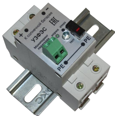
Рисунок 1. Внешний вид УЗИП Комменж УЗФЭС-3 300/10У

Комменж УЗФЭС-3 300/10У применяется в качестве второй ступени защиты, для подавления воздействия частичного (остаточного) тока молнии или индуцированного (наведенного) тока. Устанавливается рядом с инвертором или контроллером в распределительных шкафах, ящиках, коробках или боксах. Внешний вид устройства показан на рис.1, электрическая схема на рис.2., основные технические характеристики приведены в таблице.