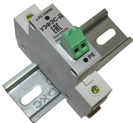
Рисунок 1. Внешний вид добавочного УЗИП Комменж УЗФЭС-Д 150/15

Комменж УЗФЭС-Д 150/15 применяется в качестве второй ступени защиты совместно с УЗФЭС-2 II+III класса испытания, для подавления воздействия частичного (остаточного) тока молнии или индуцированного (наведенного) тока. Устанавливается рядом с инвертором или контроллером в распределительных шкафах, ящиках, коробках или боксах. Внешний вид устройства показан на рис.1, электрическая схема на рис.2 и 3, основные технические характеристики приведены в таблице.